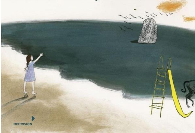
Illustration von Stefanie Harjes, Mixtvision Verlag